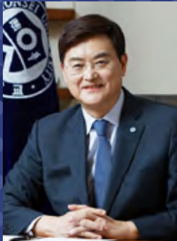
연세대학교 총장 서승환