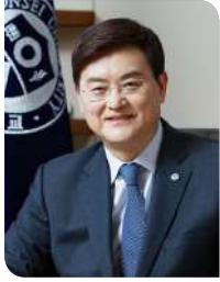
연세대학교 총장 서승환