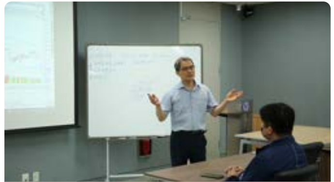
재테크 일반인들의 성공투자론