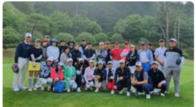
연세 골프 최고위 과정