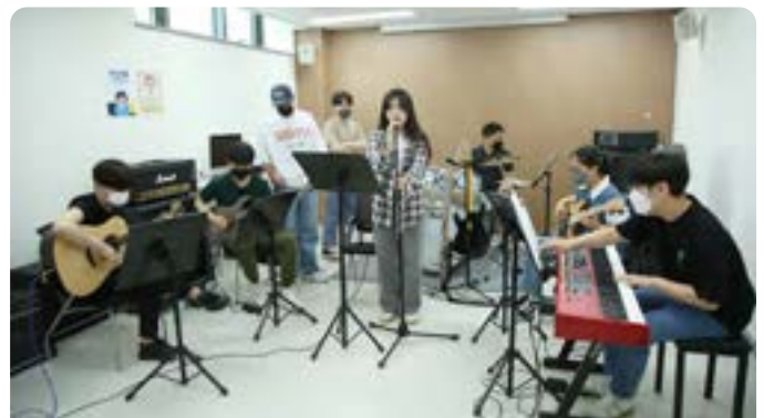
연세인 기 프로젝트