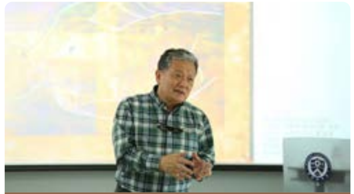
미술품 감정 평가