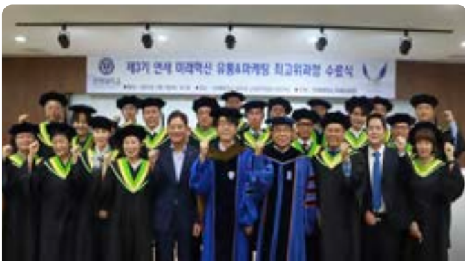
연세 디지털혁신 마케팅유통 & 금융 최고위과정