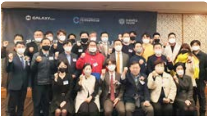
신한류 메타버스 CEO 포럼