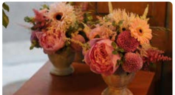
프렌치 플라워 디자인