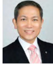
연세 세무 경영 최고위 과정 자문 조면기