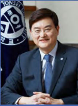
연세대학교 총장 서승환