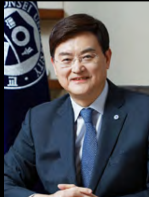
연세대학교 총장 서승환

서 벗어나 보다 매력적이고 안정적인 수익을 꾸준히 대응하며, 나아가 그 흐름을 주도할 수 있는 성공적 불리우는 이 시대에 글로벌 자산 투자에 관한 기본 글로벌 시장을 리드하고 있는 테마와 투자 이론 및 메가트렌드(Megatrends)를 찾아 최고경영자 여러분