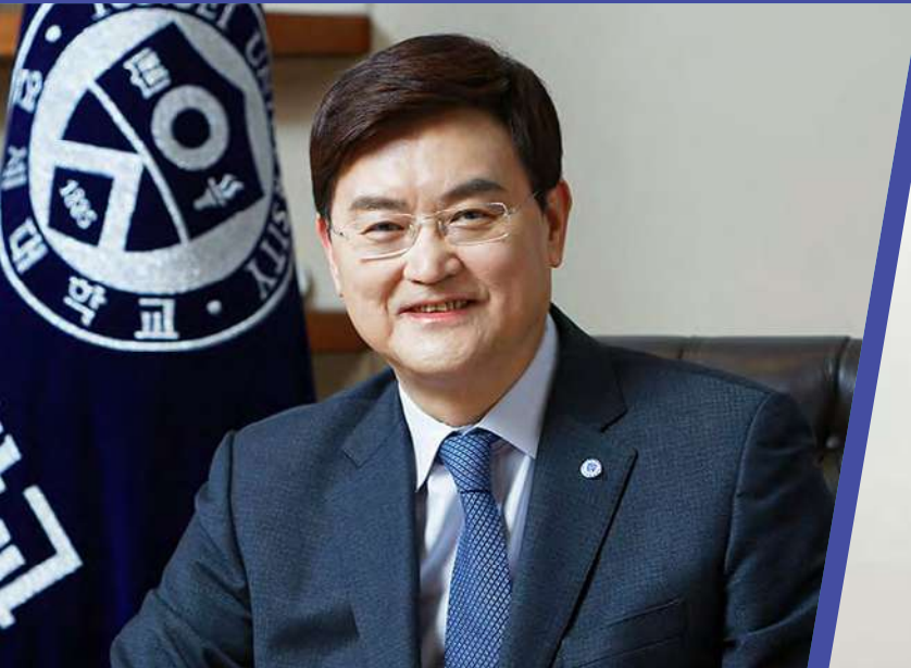
연세대학교 총장 서승환