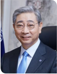
연세대학교 총장 윤 동 섭